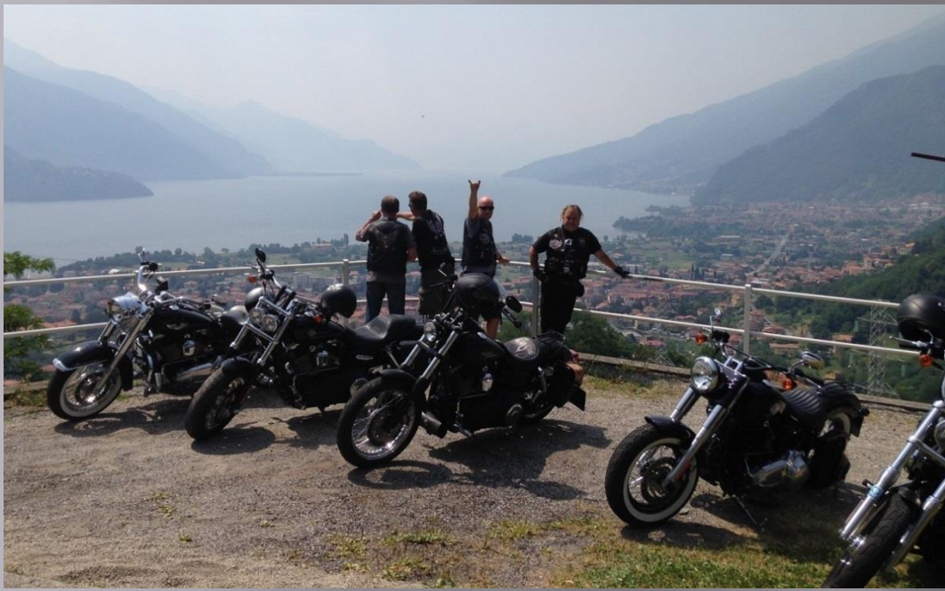
Gruppe2: Ausfahrt Comersee Hinterland