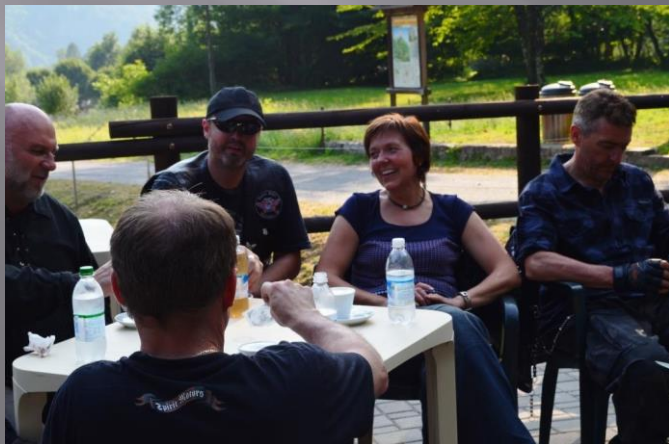
4. Stop: Cascate di Acquafraggia