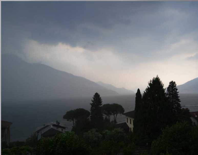
2. Abend Gewitter mit Hagel